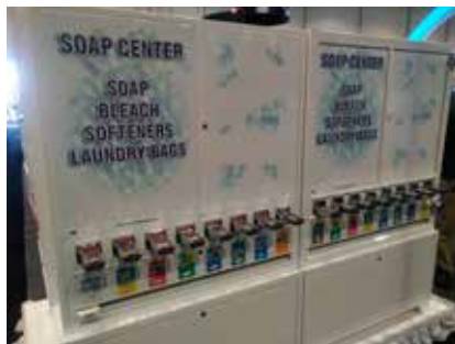
Distributeur de doses de lessives à pièces